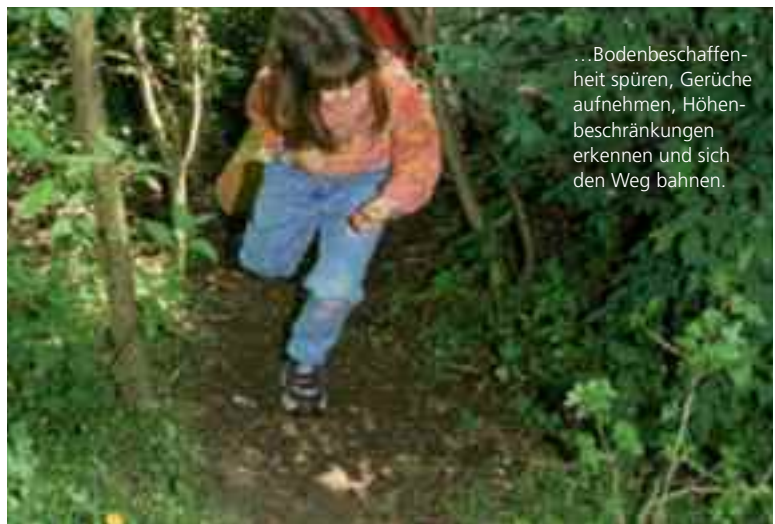
...Bodenbeschaffenheit spüren, Gerüche aufnehmen, Höhenbeschränkungen erkennen und sich den Weg bahnen.