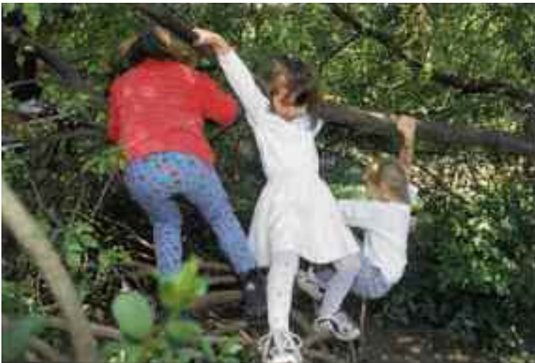
Bewegung im freien Gelände erfordert Balancegeschick – auch im Umgang mit den anderen.

Balancieren auf festen oder labilen Unterlagen, beispielsweise einem Baumstamm, fördert nicht nur das Gleichgewichtssystem, sondern auch die Wahrnehmung und Feinkoordination der Rumpfmuskulatur, deren Zusammenspiel wir, angefangen vom Stehen und Gehen, für jede weitere Bewegungsleistung brauchen.